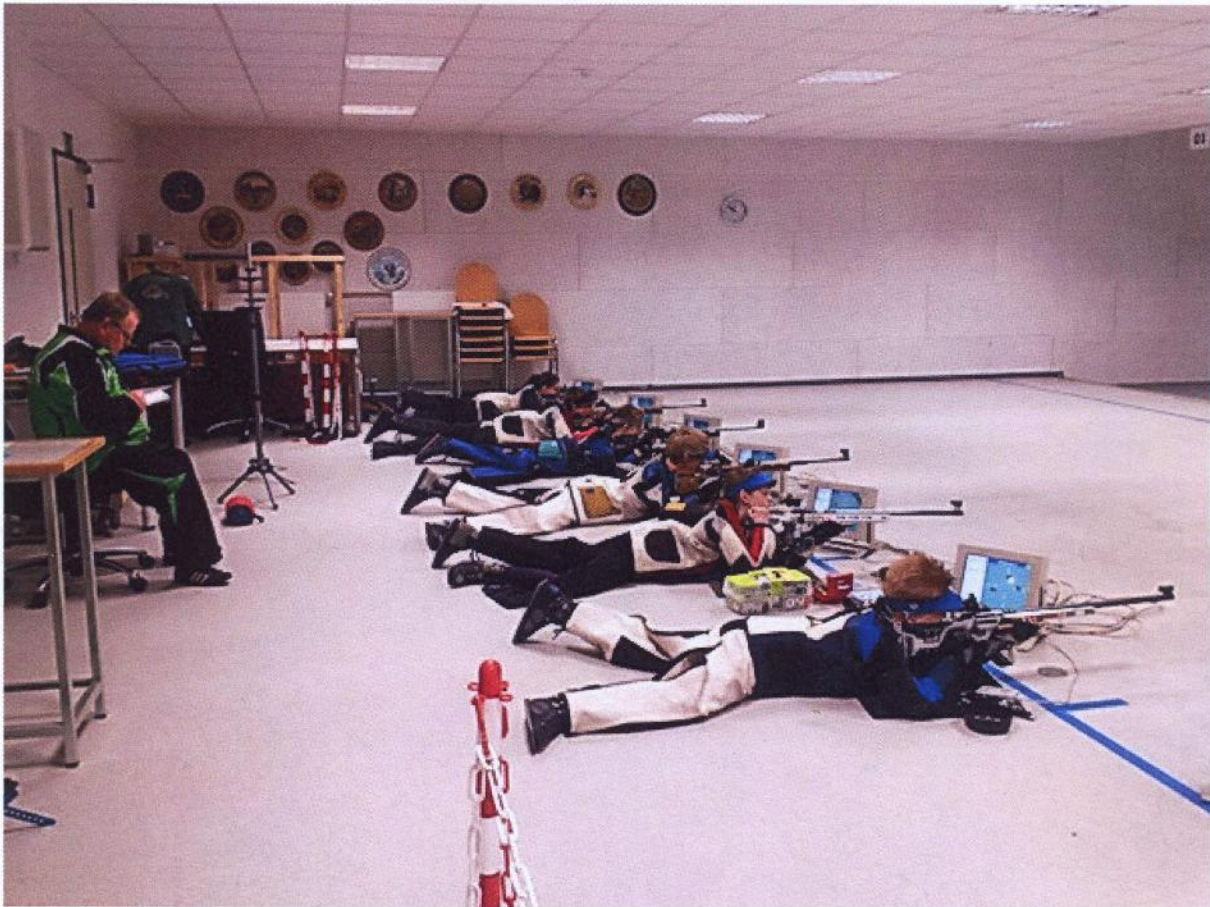
Themenbild Schützengilde Ahrensburg.

Ahrensburg (ve/pm). Seit Ende 2015 ist das Schützenwesen in Deutschland in das Verzeichnis des immateriellen Kulturerbes der UNESCO aufgenommen worden. Ein Grund mehr, findet die Schützengilde Ahrensburg, die Schützen kennen zu lernen.